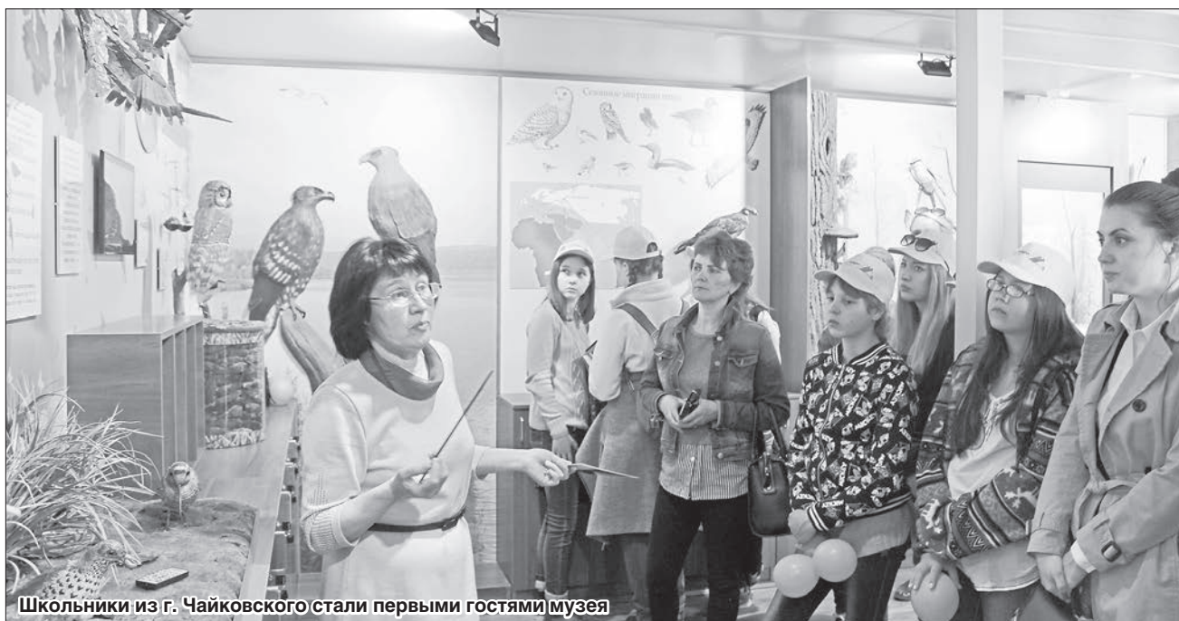
Школьники из г. Чайковского стали первыми гостями музея

и охраны окружающей среды Удмуртии Евгения Чижова, музей не только внесёт большой вклад в экологическое воспитание людей, но и станет культурным центром Прикамья, подлинным хранителем природных и культурных ценностей народов Удмуртии. «За 20 лет национальному парку «Нечкинский» удалось внести значительный вклад в сохранение уникального природного наследия